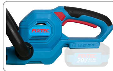
Poignée principale ergonomique avec revêtement caoutchouc.