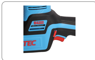
Réglage de la vitesse par pression sur la gâchette de démarrage.