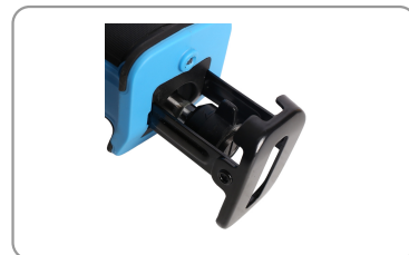
Collet à serrage rapide et sabot orientable.