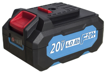
Batterie 20V Li-Ion 4.0 Ah