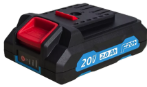
Batterie 20V Li-Ion 2.0 Ah