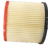
Replacement pleated filter