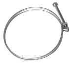
Hose clamp Ø 100 mm