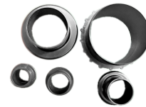
Set of adapters