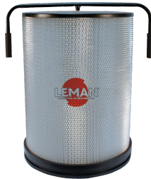
Filter cartridge 1 micron Ø 510 mm, height 600 mm