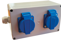
Synchronised machine starter box (230 V)