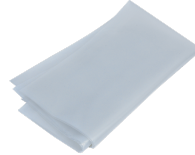
Plastic collection bag Ø 500 x 1250 mm