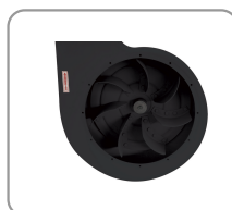
Hélice en acier