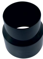
Adapter Ø max 120 to 100 mm, length 110 mm