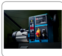
Electronic speed controller