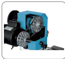
Variomatic speed control