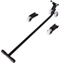
Mobile wheel kit