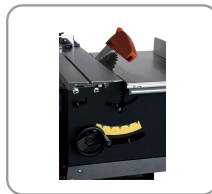
1320 mm sliding carriage flush with the blade