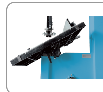
Table tilting at 45°