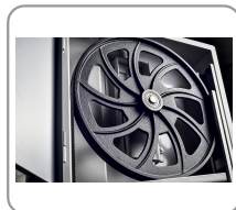
Balanced cast iron flywheels