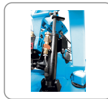
Descente de l'archet par vérin hydraulique avec débit réglable