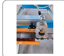
Guide de lame avec buse pour liquide de refroidissement