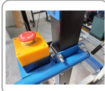
Bouton darret durgence