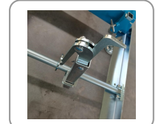
Griffe de maintien à serrage excentrique