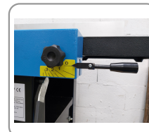
Réglage de la table d'entrée par levier excentrique