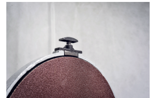
Frein du disque