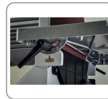
Table tilting at 45°