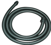
Suction hose with bayonet Ø 38-32 mm, 4 m