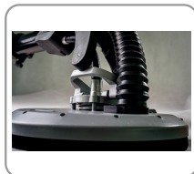
Pivoting sanding head