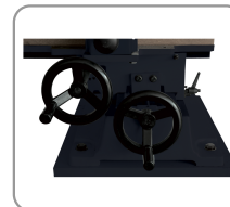
Lateral and longitudinal strokes on dovetail slides