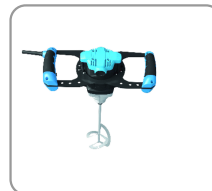
Poignées ergonomiques avec revêtement soft-grip.