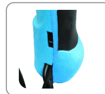
Molette de réglage.