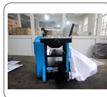
Système d'aspiration intégré (avec sac de récupération)