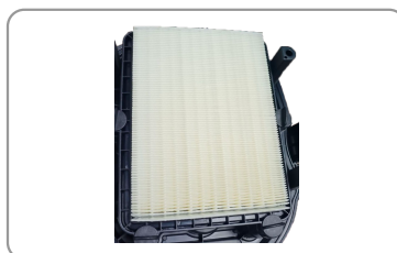
Décolmatage automatique par impulsions