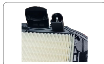
Sondes de remplissage pour liquides