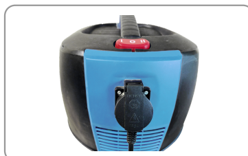
Prise synchronisée pour appareil électroportatif