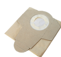
Filtre sac papier petit format 30 L (lot de 5 pièces)