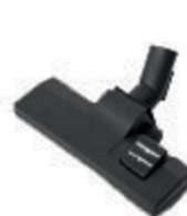
Suceur pvc poussières et liquides