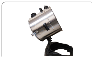
Cuve basculante pour l'évacuation des déchets