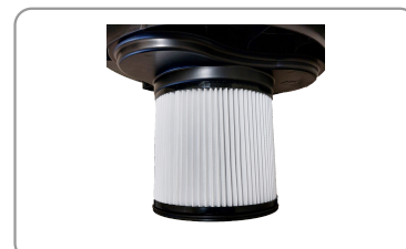
Filtre plissé hepa