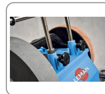
Ø 12 mm f-bracket with adjustment wheel