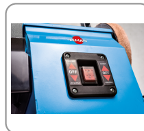
Interrupteur marche/arrêt avec sélection du sens de rotation