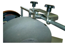
Diamond truing device