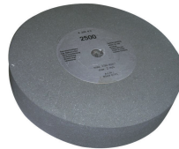
Corundum grinding wheel Ø 250 mm, grain 220