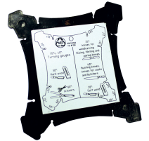
Angle measurement jig