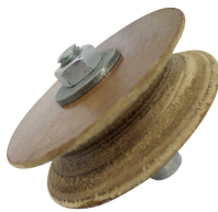
Gouge leather honing disc