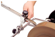
Gouge sharpening device