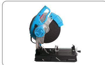
Grande poignée ergonomique en d.