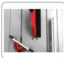
Guide d'angle réglable à 45°.