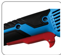
Gâchette de démarrage avec bouton de déverrouillage.