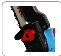
Changement de lame rapide et facile.