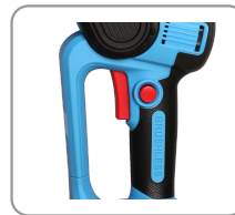
Compacte, légère, pratique et maniable.