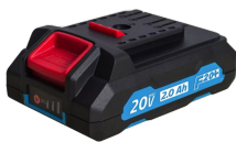
Batterie 20V Li-Ion 2.0 Ah