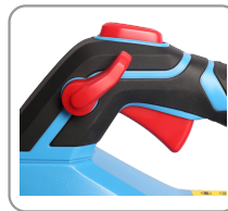
Mode turbo pour un gain de puissance supplémentaire.