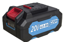
Batterie 20V Li-Ion 4.0 Ah