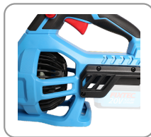
Moteur sans balais de charbon.