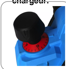
Profondeur réglable tous les 0,1mm en continu.