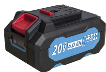
Batterie 20V Li-Ion 4.0 Ah