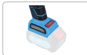
Carter de protection pour meulage avec fixation à serrage rapide.