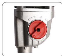
2 plages de vitesses mécaniques.