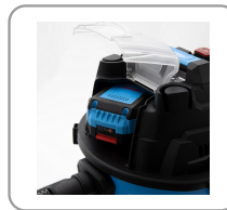
Compartiment à batterie.