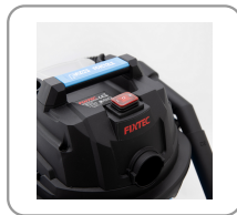
2 vitesses d'aspiration + fonction souffleur.