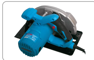
Poignées de préhension ergonomiques.