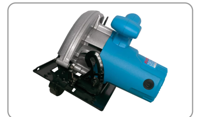
Angle de coupe réglable jusqu'à 45°.