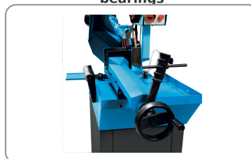
Quick clamping vice with slack adjustment lever