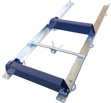
1950 mm track extension