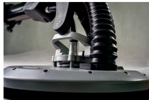
Pivoting sanding head