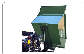
Benne à basculement hydraulique