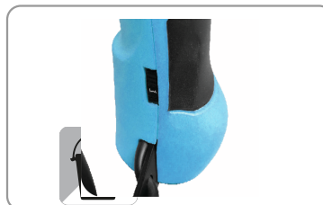
Molette de réglage.