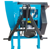
Attelage 3 points et entrainement sur prise de force.