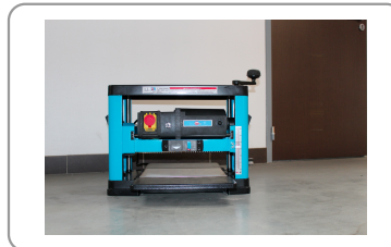
Galvanised steel thicknesser table