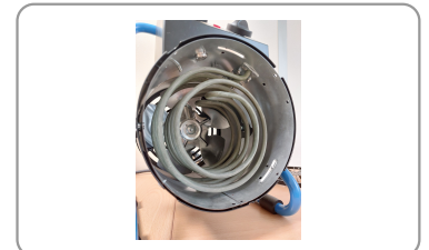
2 résistances indépendantes de 1500w chacune