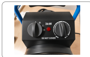
Fonction ventilation seule