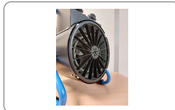
Ailettes canalisant le flux d'air