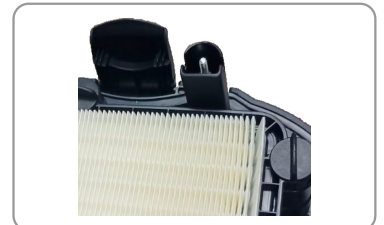
Sondes de remplissage pour liquides