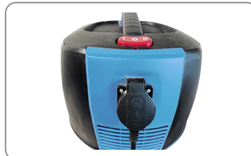
Prise synchronisée pour appareil électroportatif