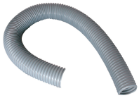
Hose Ø 100 mm pvc (unit : 1 meter)