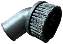
Brosse ronde (Ø38mm)