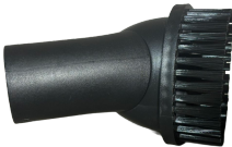
Brosse demi-ronde (Ø32mm)