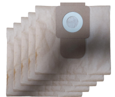
Sac filtre en papier (lot de 5 pièces)