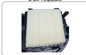
Décolmatage automatique par impulsions