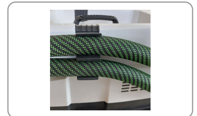
Flexible d'aspiration à gaine lisse renforcée