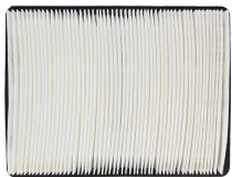
Filtre plissé HEPA E11 lavable