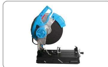
Grande poignée ergonomique en d.