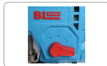
Mouvement pendulaire à 4 positions.