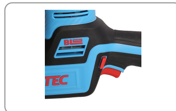
Réglage de la vitesse par pression sur la gâchette de démarrage.