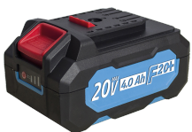
Batterie 20V Li-Ion 4.0 Ah