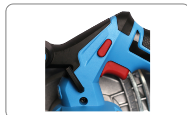
Gâchette de démarrage avec bouton de déverrouillage.