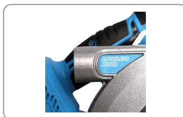
Sortie d'aspiration sur le carter de protection.