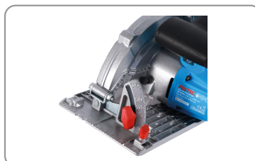
Angle de coupe réglable.