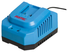
Chargeur rapide de batterie 20V Li-Ion.