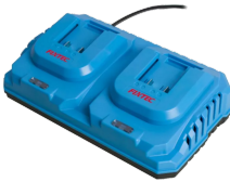
Chargeur rapide double batterie 20V Li-Ion.